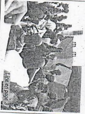
Lire en page 3