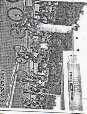
Lire en page 8